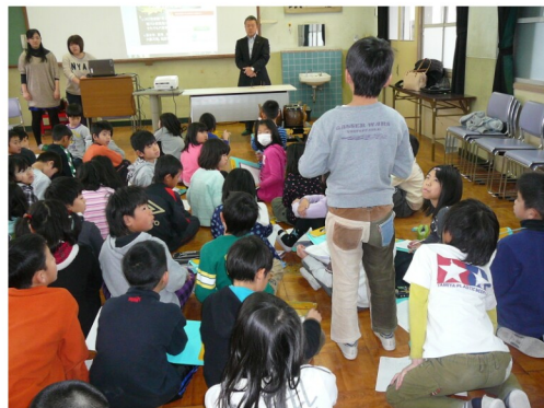
子どもたちから多くの質問が出されました

祥院天満宮での大祭では感じることでできないものがあつたからだと思っています。話を聞くだけではなく、太鼓を触ったり、実際にたたいてるところを間近に見ることで、意欲につながったのだと感じました。私たちにとっても模擬授業