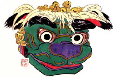
国の重要無形民俗文化財指定 吉祥院六齋念仏踊り

It has been designated an Important Intangible Folk Cultural Property. Kisyoin Rokusai Nenbutsu Odori. designated in 1983.