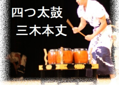
四つ太鼓 三木本文

吉祥院六齋念仏 歴史を紐解く 呉竹文化センターホール 六齋単独公演 吉祥院六齋念仏保存会