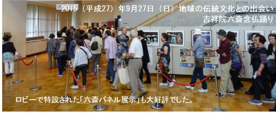
ロビーで特設された「六齋パネル展示」も大好評でした。

地域の伝統文化との出会い 吉祥院六齋念仏踊り 午後二時開場 午後一 午後二時開場 午後一 午後二時開場 午後一 午後二時開場 午後一