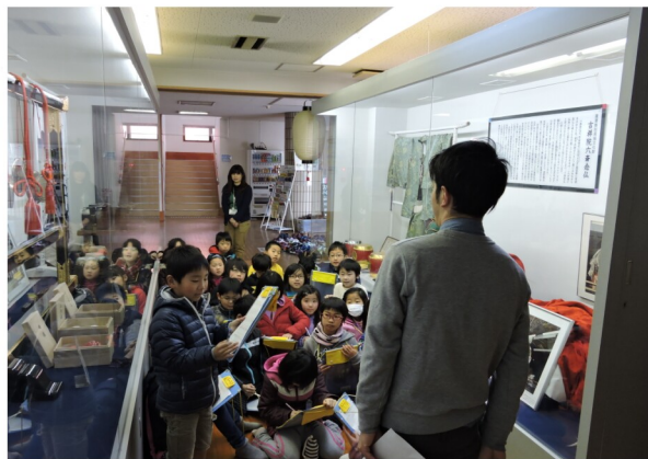
吉祥院六斎歴史資料展示室を見学(平成28年2月10日)

取り組みを広く紹介し、伝統文化を通じて、市民の幅広い交流を図るとともに、訪れる方々に生まれ育った地域への愛情や人と人のつながりの大切さを見つめ直す機会になればと願っています。