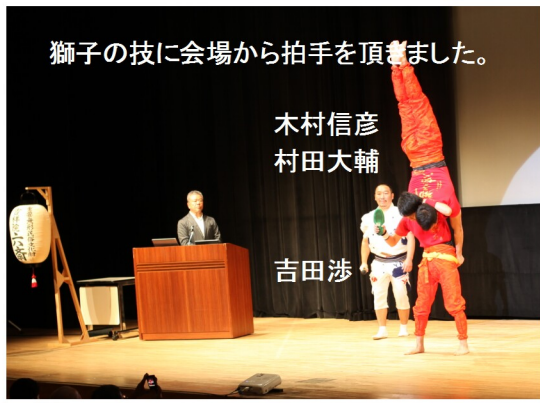
獅子の技に会場から拍手を頂きました。