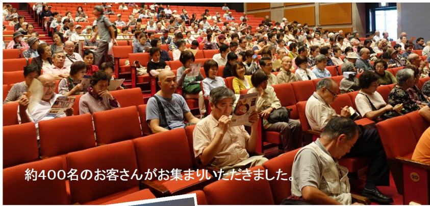
約400名のお客さんがお集まりいただきました。