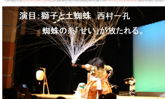
演目: 獅子と土蜘蛛 西村一孔 蜘蛛の糸「せい」が放たれる。