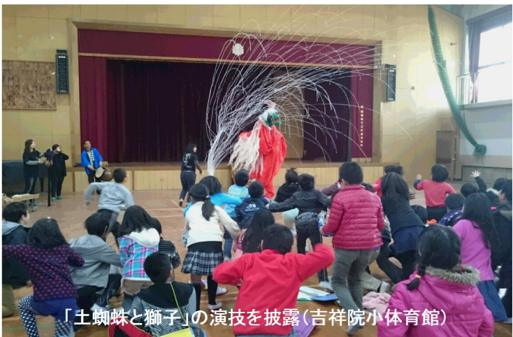
「土蜘蛛と獅子」の演技を披露(吉祥院小体育館)

てもらえるために、こちら側が歩み寄っていかずには、子どもたちの興味関心をいかに引き出すかが授業の難しいと痛感しました。