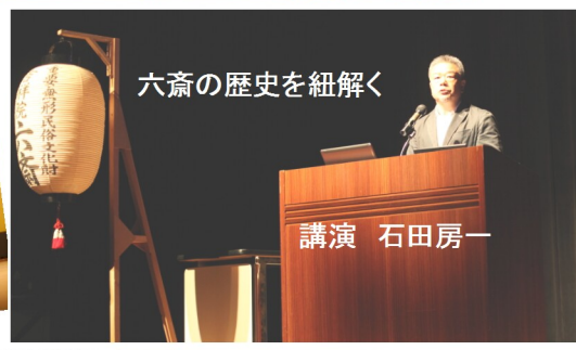
六齋の歴史を紐解く