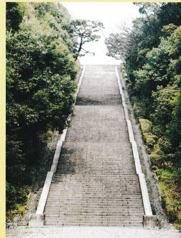
(明治天皇陵大階段)