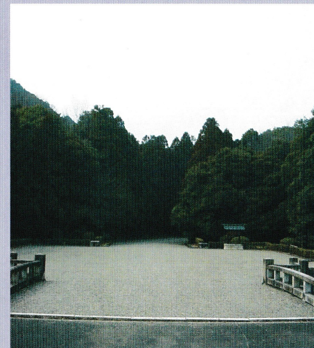
(神武天皇陵表参道入口)