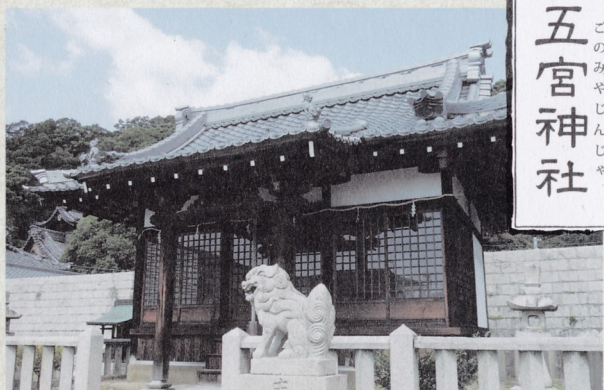
ごのみやじんじや 五宮神社

ご祭神:天穂日命(あめのほひのみこと) ご祭神は、出雲国能美郡天穂日神社より招かれ、天照大神のお使いとして、国土発展と経営に努力された神様とされています。