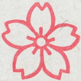
一宮神社 いちのみやじんじや