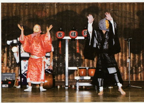
安達ヶ原（あだちがはら）

中太鼓四個を枠にはめて鼓打が一人又は二人でテン鼓を軽妙に打ち分ける。二ブチをかたげて右だけで打つ。また、太鼓を六個に相打ちする「六ツ太鼓」が