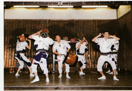
大文字 (だいもんじ)

中太鼓四個を枠にはめて中央に据え、太鼓打が一人又は二人でテンポ早く四つの太鼓を軽妙に打ち分ける。二本ブチと左肩にブチをかたげて右だけで打つ一本ブチとがある。また、太鼓を六個に増やし、二人で相打ちする「六ツ太鼓」がある。