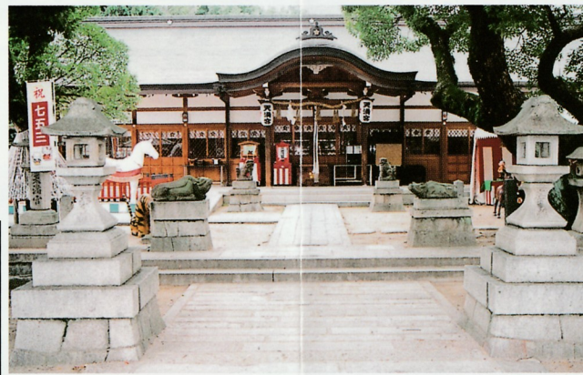
吉祥院天満宮拝殿