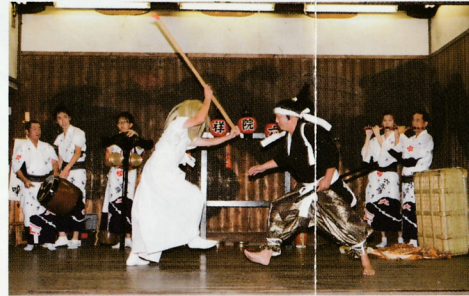
白ハリ太鼓 (豆太鼓)

岩見重太郎のヒビ退治を演じる芸物で、鉦・太鼓・笛の囃子が付く。妖怪変化の地舞、妖怪変化と岩見重太郎の立回り、ヒビ（猿）と岩見重太郎の立回りの三段からなる。