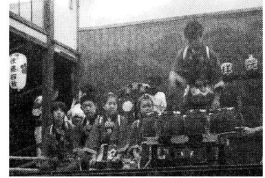
吉祥院子ども六斎会

国の重要無形民俗文化財に指定を受けた吉祥院六斎念仏踊りが今日まで、なお継承され、諸先輩方が立派に守り続けてくださったことを心より感謝申し上げます。また、吉祥院六斎歴史研究会獅子の如くの皆様のご努力の賜物であります。