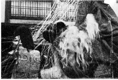
吉祥院六斎保存会