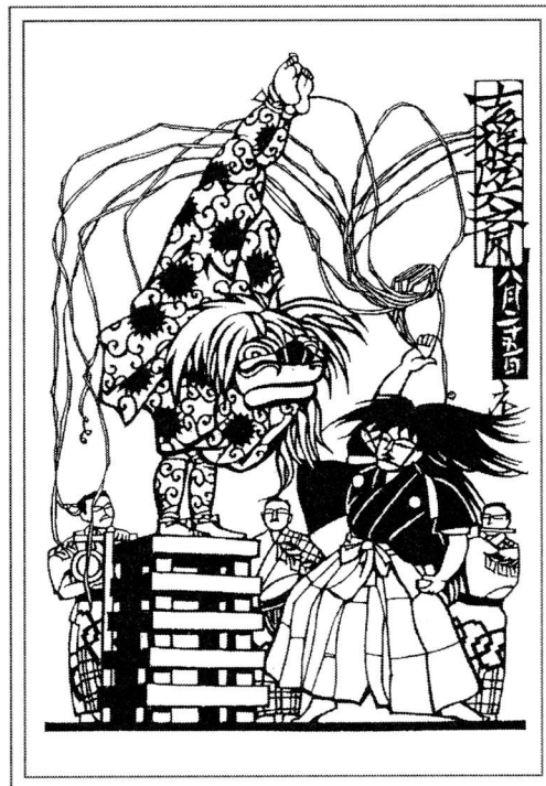
京のまつり・年中行事「切り絵」より 八月二十五日 吉祥院六齋念仏踊り 吉祥院天満宮

It has been designated an Important Intangible Folk Cultural Property. Kissyojin Rokusai Nenbutsu Odori. designated in 1983.