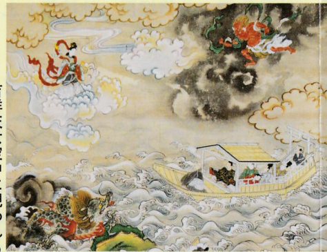
吉祥天女空中に現われる

毎年八月二十五日夜に氏神の吉祥院天満宮夏季大祭で行われる吉祥院六斎念仏の奉納は、長い歴史と伝統を持ち、京都の夏を彩る著名行事の一つとして、広く市民や観光客に親しまれています。 出演者は揃いの浴衣を着て、笛・鉦・大中小の太鼓などを用い、また芸物には特別の衣装を用い、それぞれ数人が分担して演じます。曲目には大別して、笛・鉦を伴奏に太鼓の曲打、早打、踊打を主とする太鼓曲(四ツ太鼓、祇園雑など)と、笛・鉦・太鼓の離子で行う芸物(安達ヶ原、岩見重太郎など)があり、獅子舞がよく知られています。