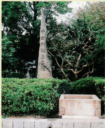
⑤「菅公御誕生之地」碑と「産湯の井」跡

明治三十五年の菅公千年祭以来、氏子崇敬者の篤い御支援を得て逐次復興に努め、本殿改築(昭和二十八年)や吉祥天女社の大修理(昭和三年)、境内神域の拡張整備(昭和三十三年)、祝詞殿新築(昭和五十二年)、平成十四年の菅公千百年大萬燈祭には拝殿改築や文章院新築などなし得たこと、道真公の高き御神徳の賜と深く感謝するところである。