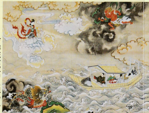
吉祥院天満宮縁起 (第一幅)

六齋念仏は、平安時代に空也上人が信仰を広めるために鉦や太鼓をたたいて踊躍念仏をはじめたのが起りといわれ、これが後に仏典に説く8・14・15・23・29・晦日の六齋日に行われ、六齋念仏と呼ばれるようになったと伝えられます。 室町時代中期頃から民衆のみで行われるようになり、能楽や歌舞伎等を取り入れる工夫が加えられ、芸能色豊かな六齋念仏に発展して、本来の六齋日と関わりなく盆の行事として伝えられて来ました。 現在、京都市内には十数組の六齋念仏が伝承されていますが、吉祥院六齋は永くその中心にあり、昭和二十八年には京都を代表する六齋念仏として国から無形文化財に指定され、昭和五十八年には他の六齋念仏とあわせて国の重要無形民俗文化財に指定されました。 毎年八月二十五日夜に氏神の吉祥院天満宮夏大祭で行われる吉祥院六齋念仏の奉納は、長い歴史と伝統を持ち、京都の夏の彩る著名行事の一つとして、広く市民や観光客に親しまれています。 出演者は揃いの浴衣を着て、笛・鉦・大中小の太鼓などを用い、また芸物には特別の衣装を用い、それぞれ数人が分担して演じます。曲目には大別して、笛・鉦を伴奏に太鼓の曲打、早打、踊打を主とする太鼓曲(四ツ太鼓、祇園雑など)と、笛・鉦・太鼓の雑子で行う芸物(安達ヶ原、岩見重太郎など)があり、獅子舞がよく知られています。