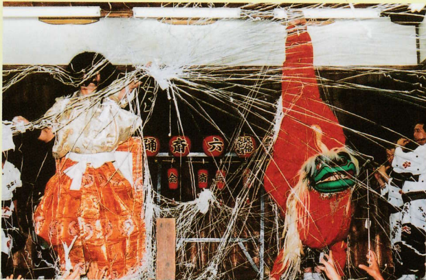
吉祥院六齋念仏・獅子と土蜘蛛

六齋念仏は、平安時代に空也上人が信仰を広めるために鉦や太鼓をたたいて踊躍念仏をはじめたのが起りといわれ、これが後に仏典に説く8・14・15・23・29・晦日の六齋日に行われ、六齋念仏と呼ばれるようになったと伝えられます。 室町時代中期頃から民衆のみで行われるようになり、能楽や歌舞伎等を取り入れる工夫が加えられ、芸能色豊かな六齋念仏に発展して、本来の六齋日と関わりなく盆の行事として伝えられて来ました。 現在、京都市内には十数組の六齋念仏が伝承されていますが、吉祥院六齋は永くその中心にあり、昭和二十八年には京都を代表する六齋念仏として国から無形文化財に指定され、昭和五十八年には他の六齋念仏とあわせて国の重要無形民俗文化財に指定されました。 毎年八月二十五日夜に氏神の吉祥院天満宮夏大祭で行われる吉祥院六齋念仏の奉納は、長い歴史と伝統を持ち、京都の夏の彩る著名行事の一つとして、広く市民や観光客に親しまれています。 出演者は揃いの浴衣を着て、笛・鉦・大中小の太鼓などを用い、また芸物には特別の衣装を用い、それぞれ数人が分担して演じます。曲目には大別して、笛・鉦を伴奏に太鼓の曲打、早打、踊打を主とする太鼓曲(四ツ太鼓、祇園雑など)と、笛・鉦・太鼓の雑子で行う芸物(安達ヶ原、岩見重太郎など)があり、獅子舞がよく知られています。