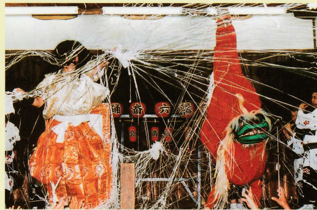
吉祥院六斎念仏・獅子と土蜘蛛