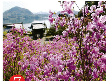
7 によ い じ 第七番 如意寺

JR 山陰本線江原駅からタクシー 10 分。北近畿豊岡自動車道日高神鍋高原 IC から北へ約 5 km、P30 台