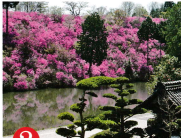
2 りょう こん じ 第二番 楞嚴寺

JR 山陰本線石原駅から徒歩 15 分。福知山駅・綾部駅からバス 20 分。観音寺下車徒歩 5 分。舞鶴若狭道福知山 IC から東へ約 5 km、P90 台