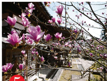
5 こう しょう じ 第五番 高照寺

http://kougengi-tanba.or.jp/ JR 福知山線柏原駅からバス 40 分。佐治下車。タクシー 10 分。舞鶴若狭道春日 IC 経由北近畿豊岡道青垣 IC から約 4 km、P100 台