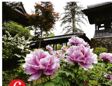
6 りゅう ごく じ 第六番 隆国寺

JR 山陰本線八鹿駅からバス 15 分。高柳下車徒歩 10 分。北近畿豊岡自動車道八鹿水ノ山 IC から西へ約 2 km、P30 台、大型 3 台