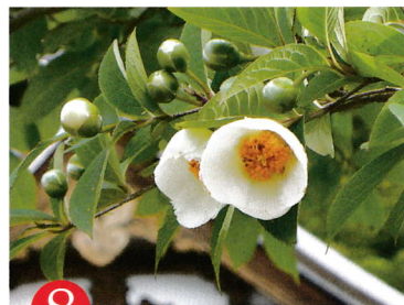
8 おう しょう じ 第八番 應聖寺

JR 山陰線豊岡駅で京都丹後鉄道宮津線に乗り換え。久美浜駅下車。徒歩 15 分。またはタクシー 3 分。京都縦貫道京丹後・大宮 IC から R312 で 27 km。北近畿豊岡自動車道日高・神鍋高原 IC から R312 で 23 km。P100 台