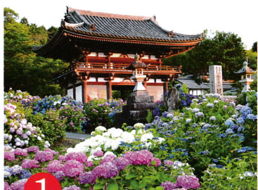
1 たんしゅうはな かん のん じ 第一番 丹州華観音寺

青紫、赤紫の花の波…ここは「丹波あじさい寺」6月初旬～7月初旬 だけ桜やフジ、紅葉、ろう梅も見逃さない (ご本尊) 十一面千手千眼観世音菩薩