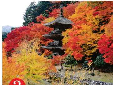
3 こん ごう いん 第三番 金剛院

JR 山陰本線綾部駅からタクシー 15 分。舞鶴若狭道綾部 IC から西へ約 5 km、P30 台