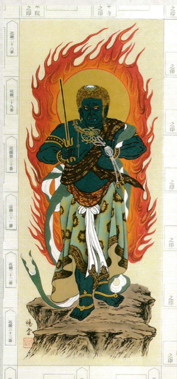
④ 新本金青不動 25,000円(税込)