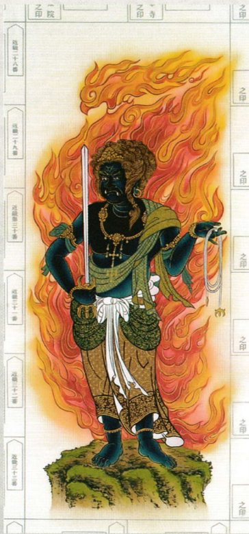
① 青不動立像 (赤不動立像もあります) 22,000円(税込)