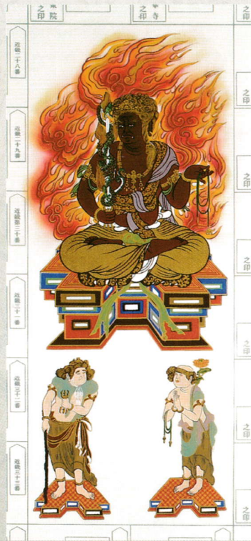
② 赤不動三尊 (青不動三尊もあります) 22,000円(税込)