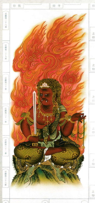
⑥ 赤不動座像 21,000円(税込)