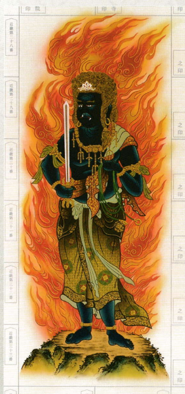
⑤ 青不動立像 21,000円(税込)