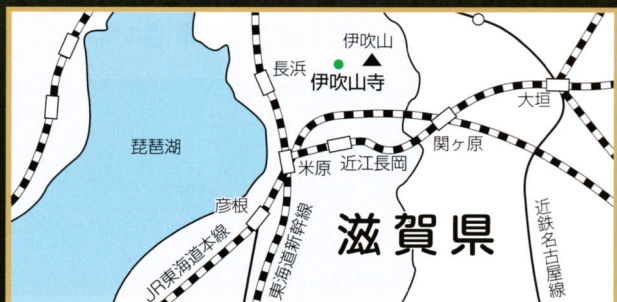
※表紙 第19番 青蓮院 国宝「青不動明王二童子像」