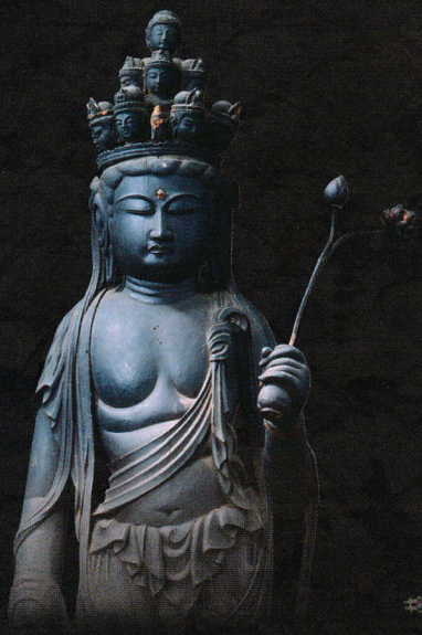
海住山寺 奥の院(重文)