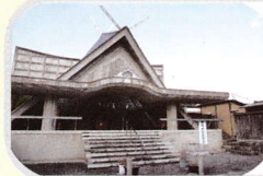
縁結び、安産、病気平癒 熊野神社衣笠分社