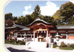
病気平癒、厄除け、旅行安全 西院春日神社