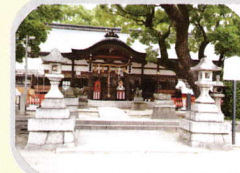
ちえと能力開発 吉祥院天満宮