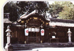
開運、良縁、心願成就 平野神社