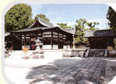
安産、子授け、縁結び わら天神宮

西大路は、京都市の西域を金閣寺の前から十条通りまで南北に通っており、東大路と対になる大通りです。この西大路をはさんだ東西両側に、古くからの歴史と由緒・格式をもつ神社が七社あります。初春にこれら七社に参拝をして朱印を受ける行事が「西大路七福社ご利益めぐり」です。全行程約七キロの西大路をまっすぐ進む比較的分かりやすい順路で、ゆっくりに歩いて一日で参拝できることや、学問・安産から開運出世・延命長寿までの人生の節目ふしめを守ってくださる神様のご利益がいただけます。健やかで幸多き一年でありますようお祈り申し上げます。