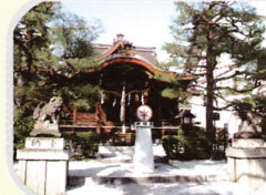
方除け、厄除け 大將軍八神社