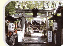
開運、出世 若一神社