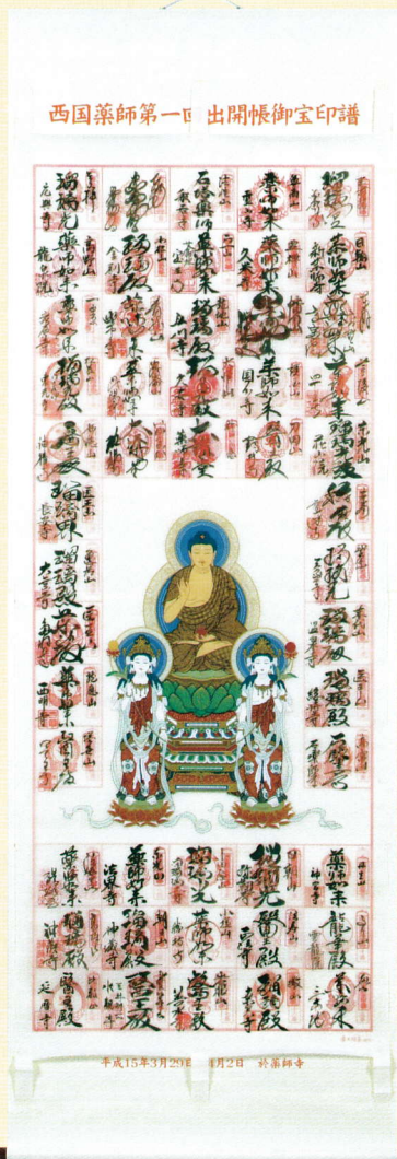
①出開帳宝印济仮巻軸