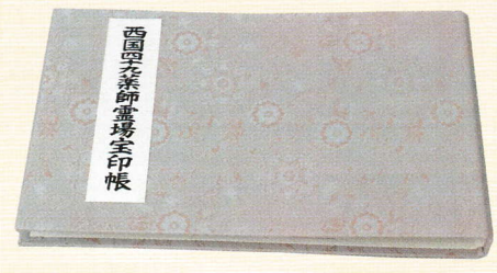
③宝印用バインダー