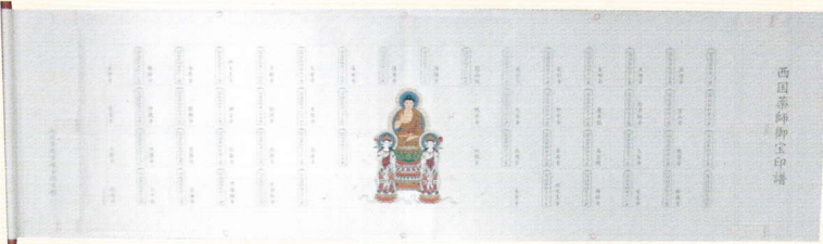
③三尊仏仮巻横額軸