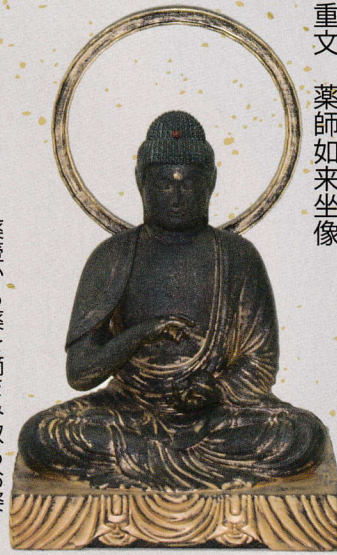
第42番 勝持寺(京都) 重文 薬師如来坐像