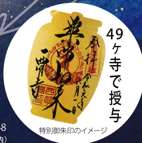
特別御朱印のイメージ

西国四十九薬師霊場会 事務局 TEL:06-4801-7188 FAX:06-6360-9848 〒530-0044 大阪市北区東天満1-11-13 AXIS南森町ビル11階(全国寺社観光協会内)