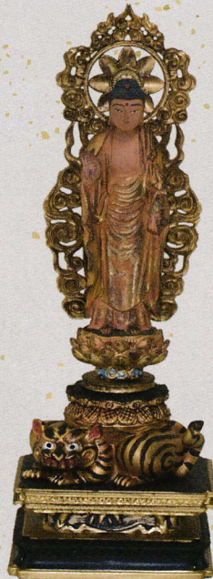
第32番 西明寺(滋賀) 秘仏 薬師如来立像(虎薬師)