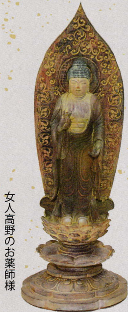
第8番 室生寺(奈良) 重文 薬師如来立像

西国四十九薬師霊場会・開創三十周年記念として、三体のお薬師様のお像（写身）をお作りいたしました。（寺院公認、数量限定、シリアルNo.付）