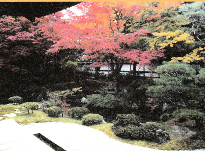
泉涌寺本坊 御座所紅葉庭園